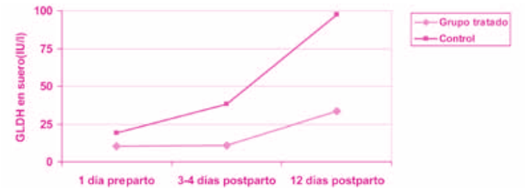
Figura 4. Concentración de GLDH en suero en el GT y en el GC antes y después del parto. A los 12 días postparto hay una diferencia significativa entre los grupos ( p<0.01 ).