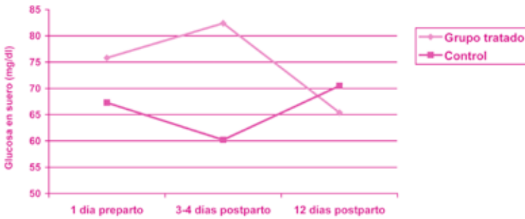
Figura 3. Concentración de la glucosa en sangre en el GT y en el GC antes y después del parto. A los 3-4 días hay una diferencia significativa entre los grupos ( p<0.001 ).